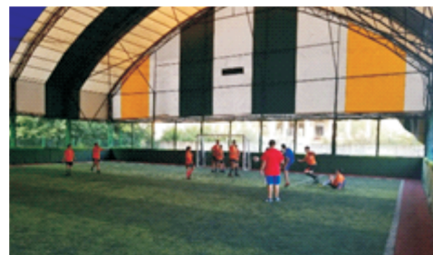
Escola de Futebol