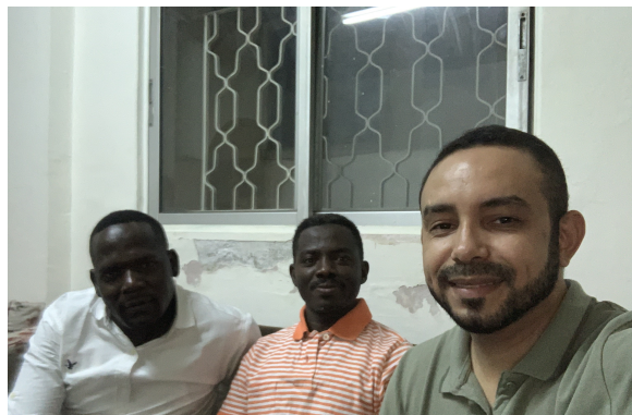
Nossos amigos refugiados

Em síntese, os nossos amigos deixaram claro que estão exaustos da vida que levam. Eles caminham aflitos e desamparados, como ovelhas sem pastor. Eles carecem de uma esperança e de um futuro. Eles anelam por um ambiente onde o muro de inimizade entre diferentes grupos étnicos já não exista mais. Eles desejam encontrar um verdadeiro lugar de refúgio. Enfim, eles almejam desfrutar uma nova vida. Será que a cruz de Cristo responde a esses anseios? Temos continuamente pedido sabedoria a Deus para apresentarmos o evangelho de forma compreensível aos nossos amigos. Quanto mais estudamos o contexto, mais identificamos caminhos pelos quais a mensagem da cruz pode percorrer de forma relevante. Senhor, por divina graça, abra os olhos espirituais e a porta da fé aos nossos amigos refugiados.