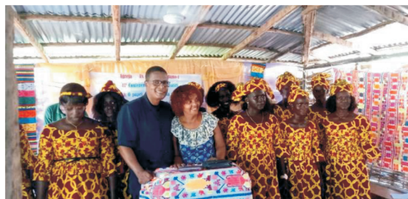
IIª Conferência das Mulheres da Igreja Evangélica de Bono 1

Atendendo ao pedido de dois pastores amigos nosso, para que déssemos o curso ONE para Noivos para seus filhos, resolvemos abraçar o desafio de dar o curso para eles via online, e para nossa surpresa, apareceram mais 4 casais interessados. Com grande alegria, no dia 18 de setembro iniciamos o curso de noivos pelo Zoom! Imaginem irmãos, da sala da nossa casa estamos ministrando para 6 casais, e só nessa turma estamos com 6 países envolvidos: Guiné Bissau, Senegal, França, Portugal, Brasil e Argentina. Quando que poderíamos imaginar isso? Deus seja louvado! Assumimos uma turma presencial de noivos, 11 casais estão sendo preparados para o compromisso da Aliança dentro dos próximos meses. É sempre uma satisfação ver o investimento que eles estão fazendo, o que com certeza terá um impacto duradouro no sucesso dos seus casamentos.