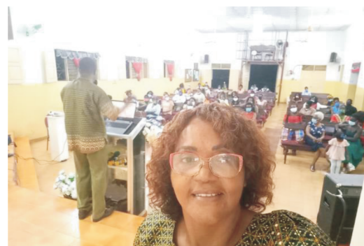
Conferência das Mulheres da Igreja Evangélica Central-Sede.