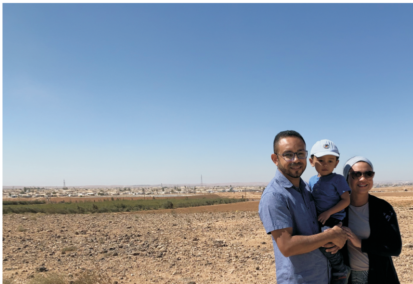
Ao fundo, Zaatari, o maior campo de refugiados para sírios do mundo