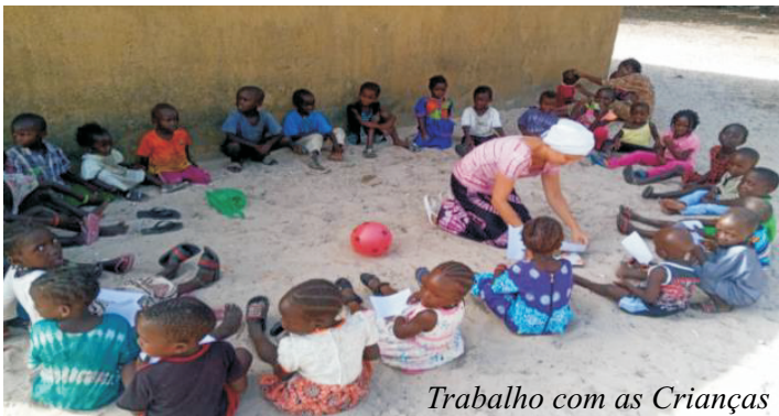
Trabalho com as Crianças

Em todos os lugares foram realizados trabalhos com crianças. Foram 357 bíblias distribuídas. Nossos parceiros das Igrejas, pastores, amigos já fizeram o treinamento da ETED conosco, estão empenhados para que possamos implantar uma base da