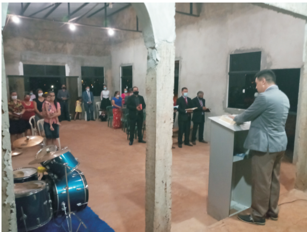
Apoio as Congregações