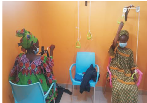
Senhoras que tiveram AVC

A MASSOTERAPIA tem sido tremendo para transmitir o amor de Deus de forma tão prática. Muitos tem sido curados do ciático, dores musculares, recuperação dos movimentos após um AVC.