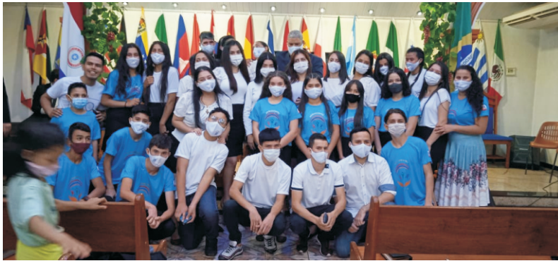
Congresso de Jovens

No mês de setembro, os jovens realizaram mais um congresso, ainda sob restrições, e por isso, com um pequeno número de pessoas. Pouco a pouco os jovens começam a se levantar neste tempo pós pandemia crendo em um reavivamento e renovação espiritual para produzirem mais frutos em sua geração.