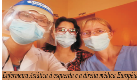
Enfermeira Asiática à esquerda e a direita médica Européia

Essas senhoras tiveram AVC, elas fazem massoterapia e na foto ao lado estão fazendo reeducação muscular.