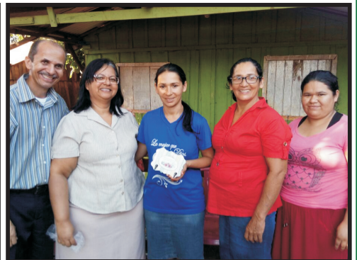
Culto no Lar