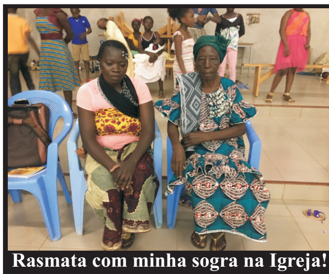
Rasmata com minha sogra na Igreja!