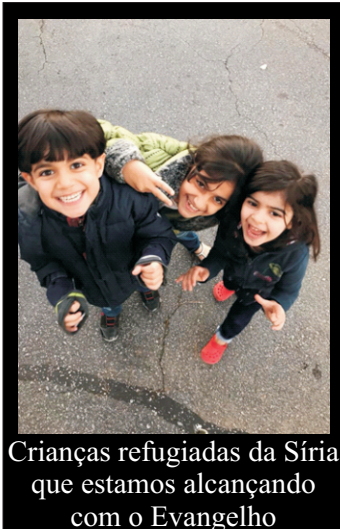
Crianças refugiadas da Síria que estamos alcançando com o Evangelho