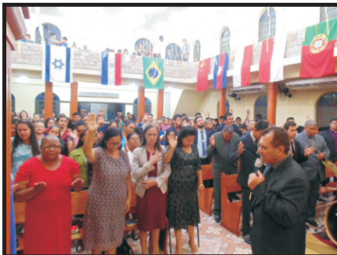
Congresso de Missões