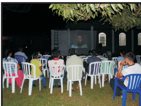
Filme Jesus em guarani