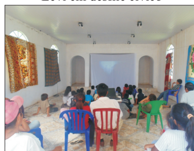
Filme para indígenas