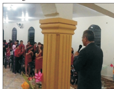
Aniversario da Cong. em Remansito - CDE