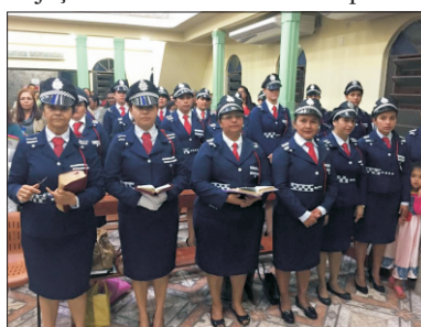
I Congresso Nacional de Mulheres