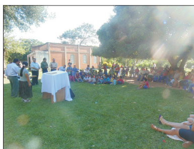
Acampamento em Santa Rosa