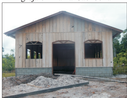
Construção da Igreja em Anamoim