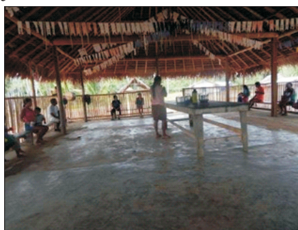
Novo Desafio Umarituba