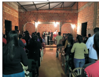
Colocação do telhado, instalação elétrica e culto em ação de graças em Presidente Franco