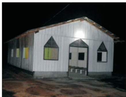
Igreja em Pamã-Cachoeira