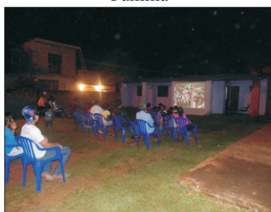
Projeção de filme em Nueva Esperanza