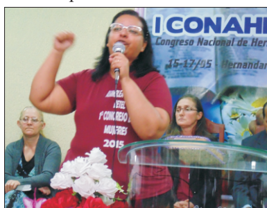
I Congresso Nacional de Mulheres