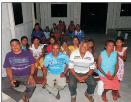
Culto em Pamã-Cachoeira