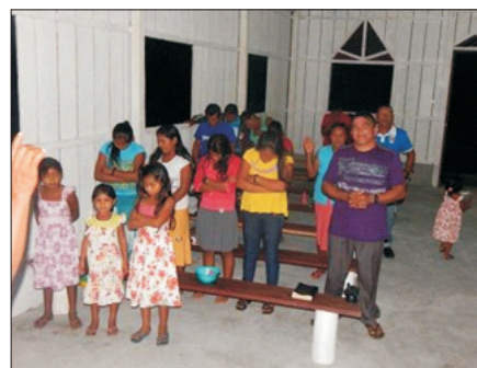
Culto em Pamã-Cachoeira