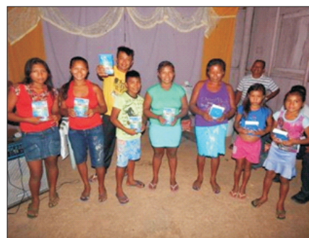
Culto em Anamoim