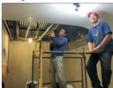
Colocação do forro