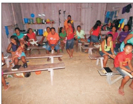
Culto em Anamoim