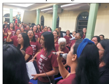
I Congresso Nacional de Mulheres